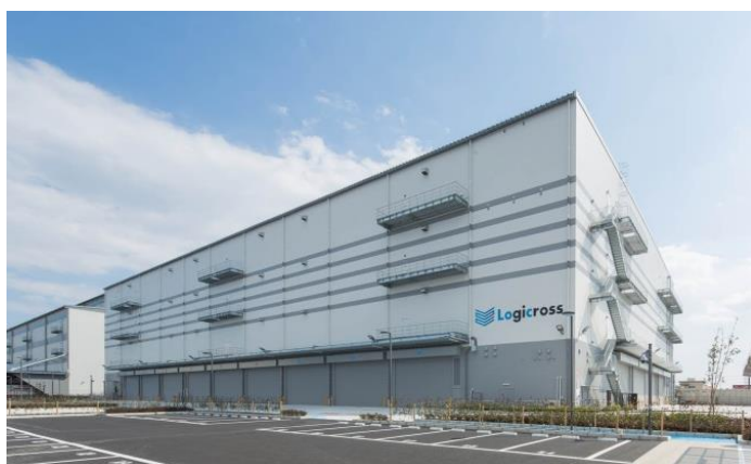
ロジクロス厚木 外観

三菱地所は、お客様の物流オペレーション効率化・ビジネス拡大をサポートすべく、総合不動産デベロッパーとして今まで培ってきたノウハウ・ネットワークを活かしながら、今後も年間2~4件の開発用地取得を目指すとともに、積極的に高機能な物流施設の開発に取り組み、国内物流網の更なる発展・効率性の向上をかなえ、優良な社会インフラの向上に貢献してまいります。