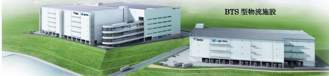
完成時の外観イメージ